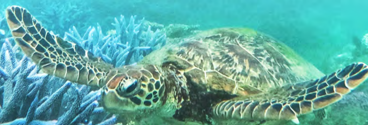
▼ 綠蠵龜為海中翱翔者穿梭於珊瑚復育棲地

近年來，種苗場透過公開徵選，與學校、社區及海域遊憩業者合作，在周邊海域試行不同的珊瑚復育方式，期望未來將保育及復育成功經驗推廣至更多地方，讓海洋保育觀念生生不息。此外，我們誠摯地邀請每一位民眾到訪澎湖海洋保育教育中心，從「知海、親海」進而「愛海」，攜手守護我們珍貴的海洋家園。期待您的加入，成為海洋守護的一分子！OCA