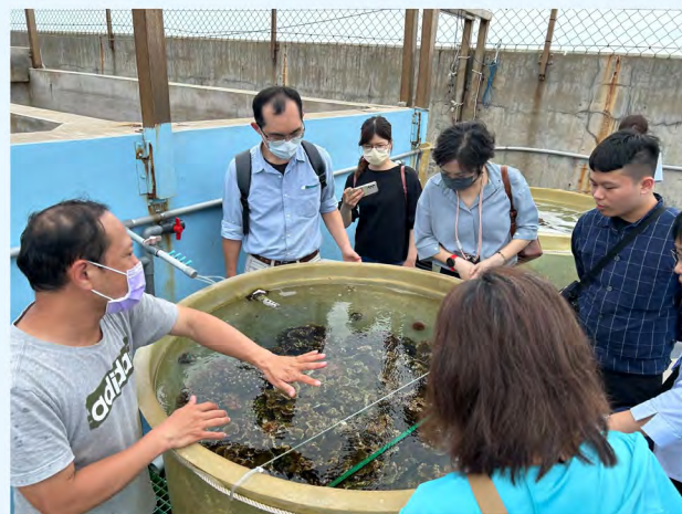
▲ 珊瑚農場可供遊客近距離觀察珊瑚

數十位企業員工自費來到澎湖，親身參與珊瑚植栽與植樹工作。他們從科技廠房走入生態復育現場，頂著烈日、捲起袖子，在專業人員指導下，按部就班地拌水泥、灌模、拆模，協助製作珊瑚復育磚。隨後，修剪珊瑚株並將珊瑚苗固定於基座上。完成陸地上的任務後，再由擅長潛水的員工換上裝備，將珊瑚苗種植到海底珊瑚磚上，為海洋生態復育貢獻綿薄之力。