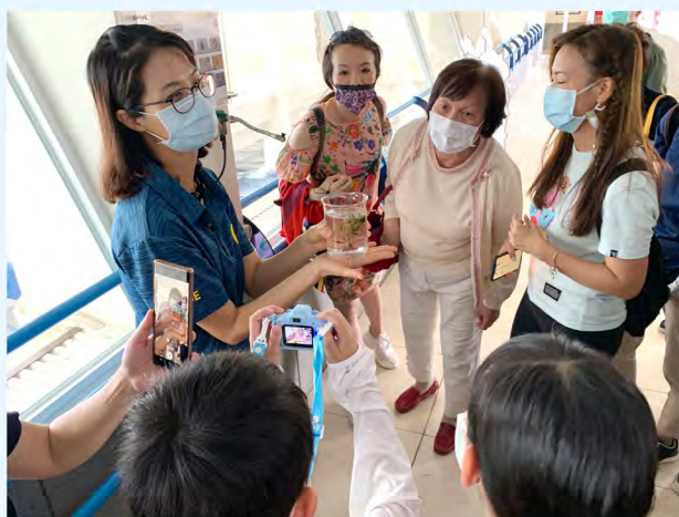
▲ 遊客可於 7 日前免費預約導覽解說服務