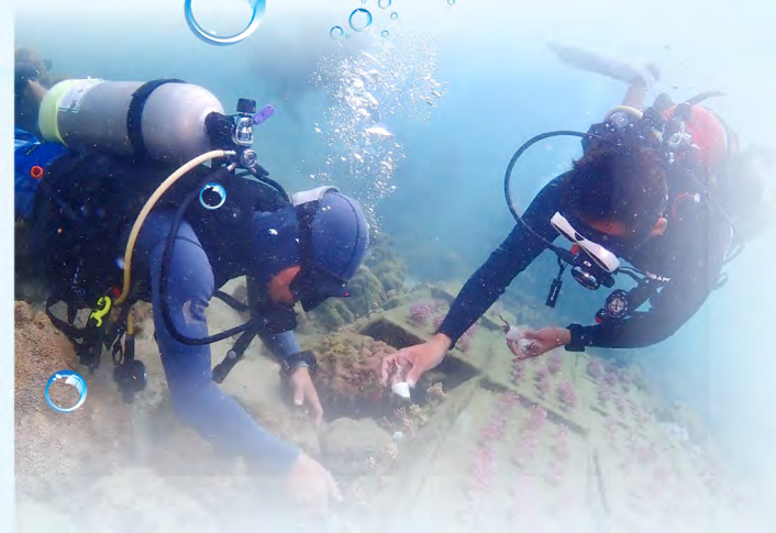
▲ 海域珊瑚植栽作業