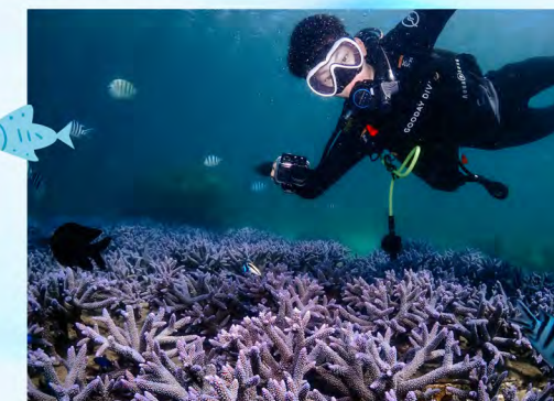
▲ 潛水客造訪紫色薰衣草珊瑚復育區