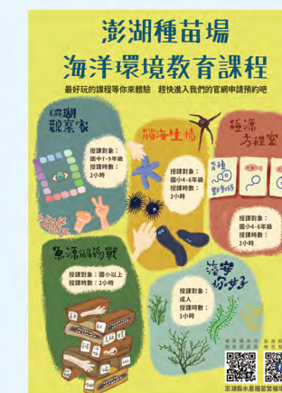
▲ 可供免費預約的環境教育課程

南方四島、七美、望安水域才有的紫色薰衣草森林，以及全年綻放、不受季節影響的粉嫩櫻花林，彷彿海底仙境。該計畫更與社區及在地業者合作，逐步實現海域自主管理，達到人與海的結合，透過這樣的努力使得漁業資源與生物多樣性得以恢復，並促進了海洋生態的永續經營。